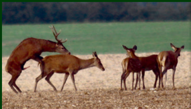
7. Prvý pokus zlyháva...