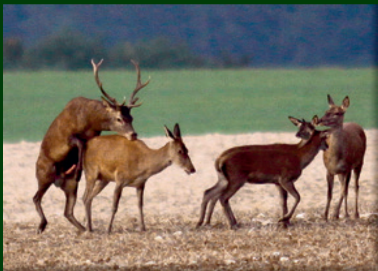
8. ...rovnako i druhý...