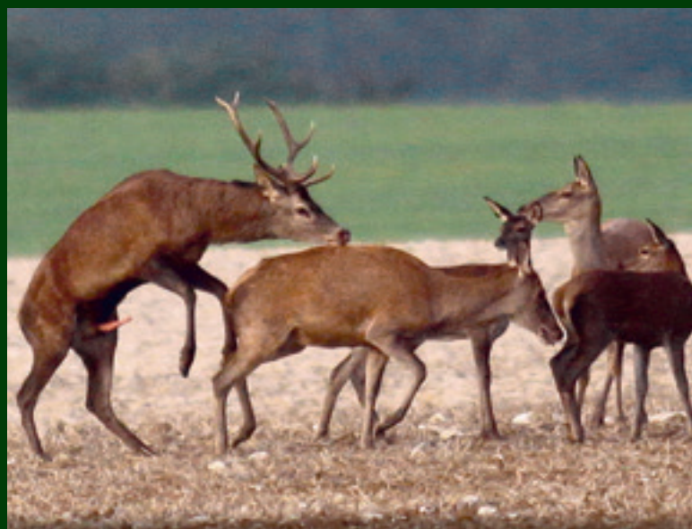
11. A je to hotové. Ak je sperma dobrá, zhruba o 240 dní príde na svet pekné bodkované jelenča.