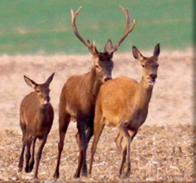
6. Unikajúca laň zabočí a prudko sa zvrtné, mláďa a jelen sú jej naďalej v päťách.