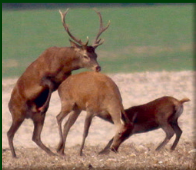
10. Nasleduje krátke párenie, jelenča sa zatiaľ pokúša cicať.