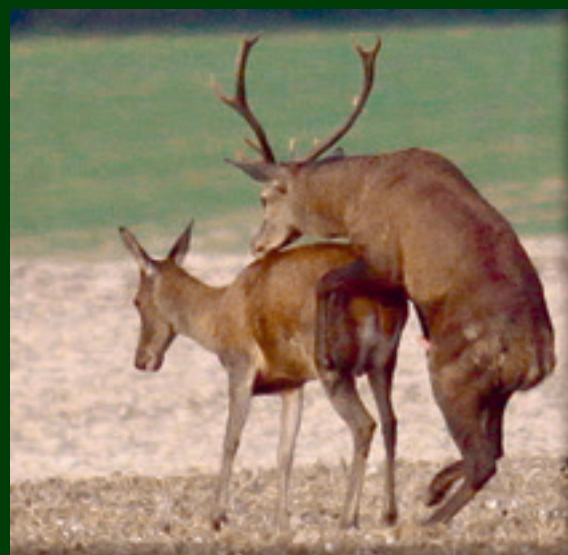
9. ...ale po polobrate laň zrazu prívolí a uľahčuje partnerovi priblíženie.